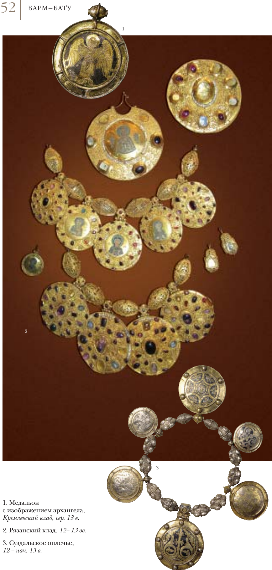
1. Медальон с изображением архангела, Кремлевский клад, сер. 13 в.