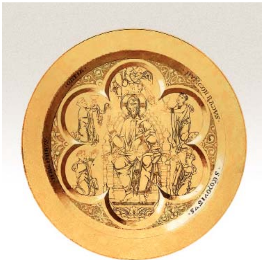
Кубок из Плоцка с изображением Конрада I и Агафьи, золото, 13 в.

■ АДАМ БРЕМЕНСКИЙ (Adam Bremensis, ум. ок. 1081) — каноник кафедрального собора в Бремене (с 1066/67), преподаватель в соборной школе, один из наиболее выдающихся латинских историографов 11 в. Его «Деяния гамбургских архиепископов» являются ценнейшим источником по ранней истории и этнической географии скандинавских, прибалтийских и восточноевропейских народов (см. также в ст. Миссионерство ). Основной текст «Деяний» (т. наз. редакция А) создан примерно в 1072—1075/76, но А. продолжал работу над ним до конца жизни. Этот вариант с многочисленными не «вработанными» в текст примечаниями-схольями (часть которых принадлежит анонимному бременскому редактору рубежа 11—12 вв.) отразился в редакциях В и С, что делает рукописную традицию труда А. (более 20 списков) весьма запутанной. Собственно историческая часть «Деяний» состоит из трех книг, охватываю-